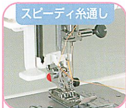
スピーディ糸通し