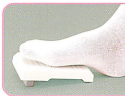
フットコントローラー