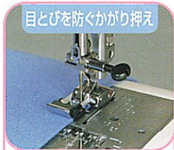
目とびを防ぐかがり押え