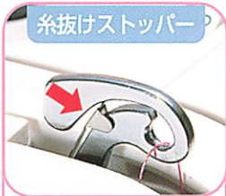
糸抜けストッパー