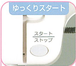
ゆっくりスタート