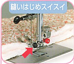
縫いはじめスイスイ