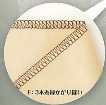
F: 3本糸縁かがり縫い